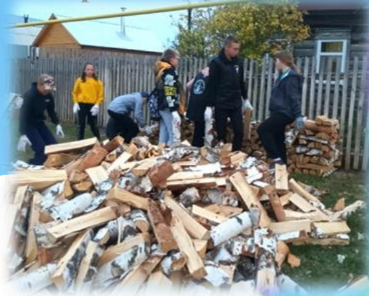
"Творить добро спешит"