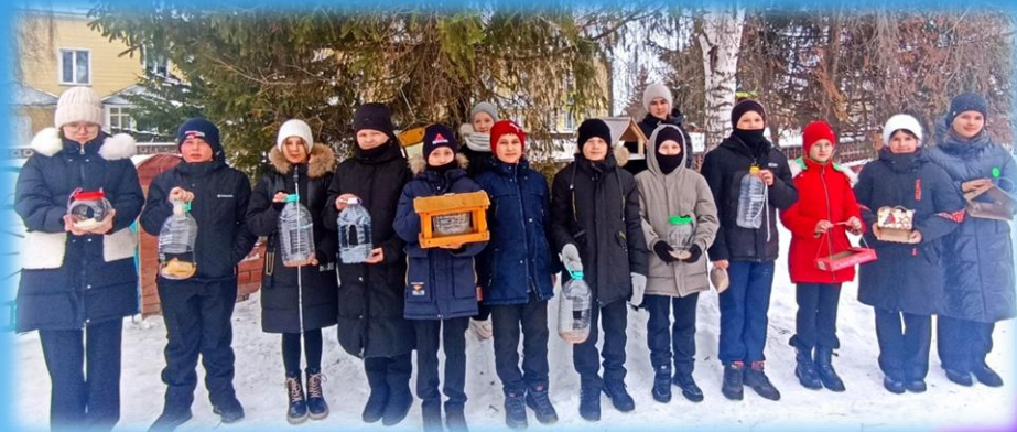
«Покормите птиц зимой!»

Наша цель: "Жить в своем самоуправлении интересной жизнью. Быть сильными, смелыми, добрыми, творческими. Важно, чтобы главным в школьном самоуправлении был ребёнок, как подрастающий, активный, сознательный, любящий Родину.