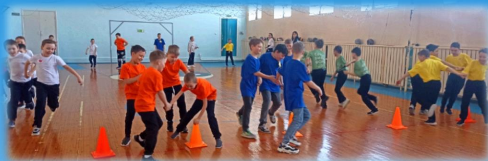
День Защитника Отечества