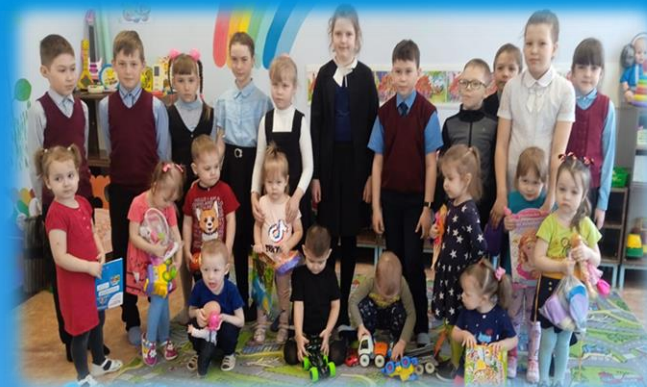
Посещение детского сада

Направления нашей деятельности: духовно-нравственные гражданско-патриотические, оздоровительные направления экологическое движение, благотворительные акции и мн.др