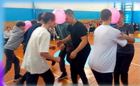
«А ну-ка, мальчики!»