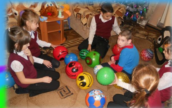
Посещение детей с ОВЗ (надомное обучение)