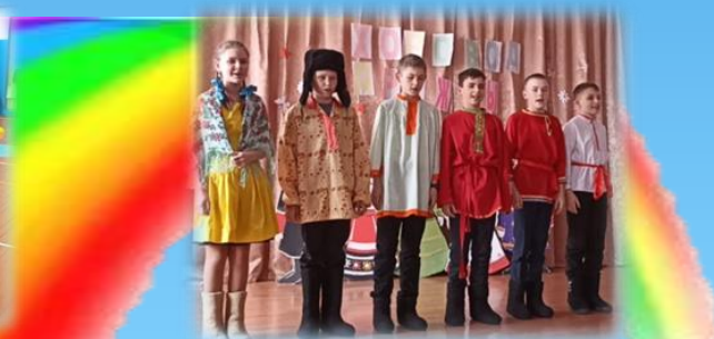
«Хоровод дружбы народов»