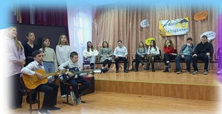
Встреча со студентами