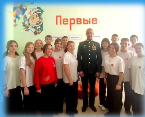
Встреча с героем

Развиваем нравственные ценности, принимаем участие в социально-значимых проектах. Уважаем и выполняем законы и традиции Государства, своей организации.