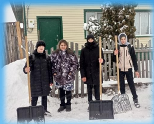
Помощь семьям СВО