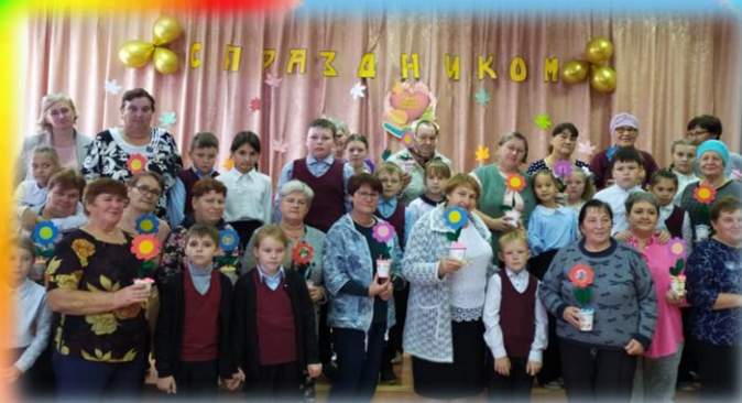
«День бабушек и дедушек»

Организация целостного процесса духовно-нравственного воспитания осуществляется через различные мероприятия, акции. Это можно увидеть на примере акций, которые проходят постоянно в нашем школьном самоуправлении.