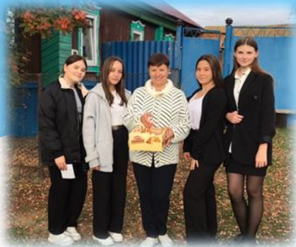
«День пожилых людей»